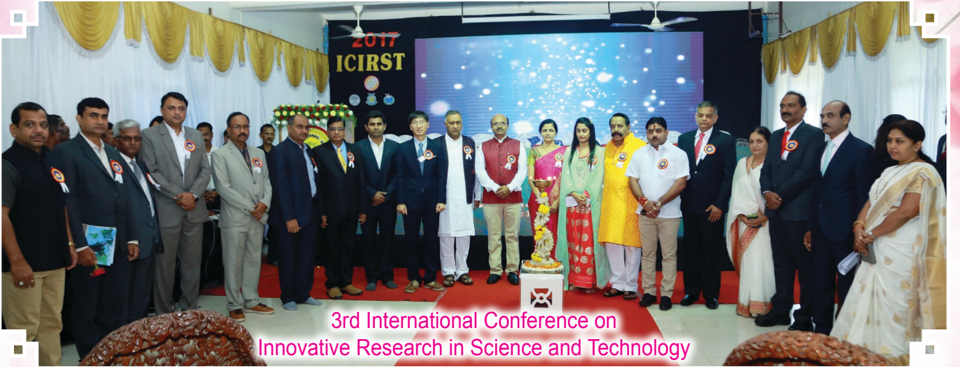
3rd International Conference on Innovative Research in Science and Technology