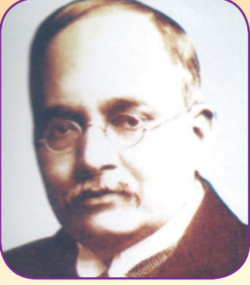
नामदार गोपाळ कृष्ण गोखले